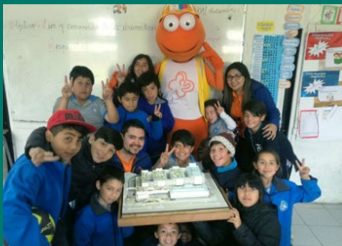
Alumnos Escuela Costa Mauco

Con los escolares se cerró el año de actividades de difusión del nuevo Hospital Dr. Gustavo Fricke. Y así como la Hormiguita mostró a sus pequeños usuarios de los establecimientos Escuela General Velázquez de Puchuncaví, Escuela Oro Negro de Concón y Colegio Costa Mauco de Quintero todas las tecnologías y espacios que tendrá el nuevo hospital, una delegación de la Escuela Óscar Marín Socías de Forestal visitó también las obras.