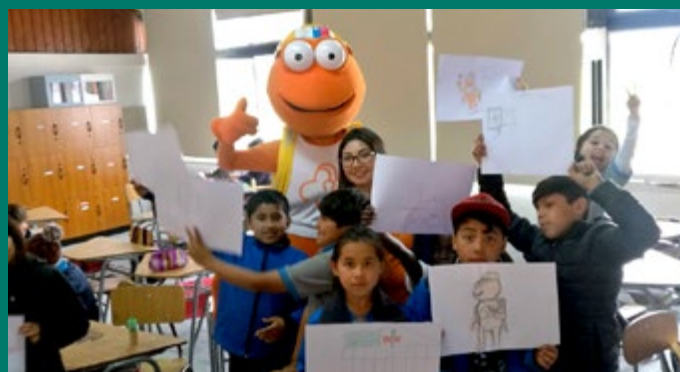
Colegio Costa Mauco de Quintero