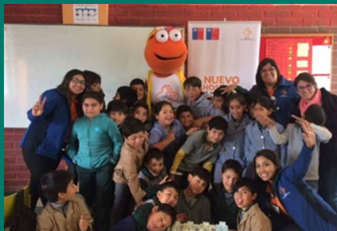
Escuela Oro Negro de Concón