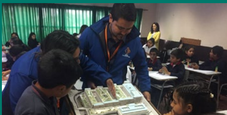
Alumnos Escuela Gral. Velásquez de Puchuncaví