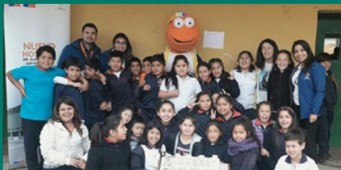
Escuela Gral. Velásquez de Puchuncaví