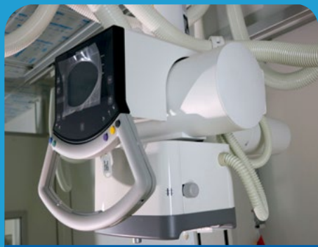
Equipo Radiológico Osteopulmonar Digital

Uno de los equipamientos más destacados del nuevo hospital es el resonador magnético nuclear, equipo único en la red del Servicio de Salud Viña del Mar Quillota (SSVQ), que realiza exámenes utilizando imanes y ondas de radio potentes para crear imágenes del cuerpo muy precisas, sin emplear radiación ionizante. Por sus requerimientos técnicos, ingresará al Nuevo hospital un mes antes de su entrada en operación, coincidiendo con la estabilización de todos los servicios