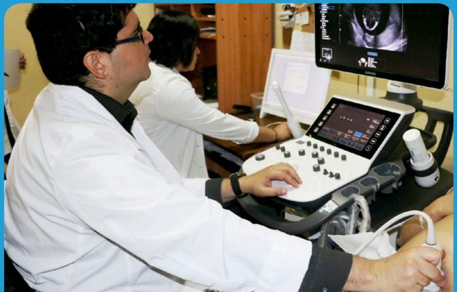
La velocidad y calidad de imagen del nuevo Ecógrafo permite hacer diagnósticos más precisos.

adquisición de información para que la ecografía pueda ser procesada después del examen por los especialistas que así lo requieran para profundizar en las