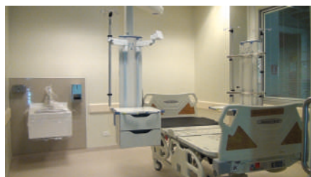
Sala paciente crítico

8 Niveles 2 Pisos subterráneos 1 Helipuerto