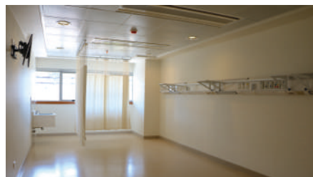
Sala de hospitalización